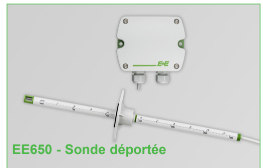
EE650 - Sonde déportée