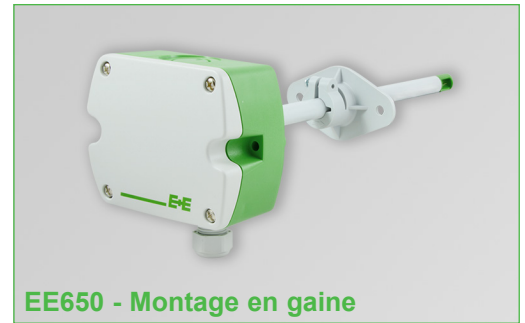
EE650 - Montage en gaine

La conception du boîtier et la bride de montage incluse dans la livraison permettent une installation et un remplacement faciles. Avec le câble adaptateur en option et le logiciel de configuration gratuit EE-PCS, l'utilisateur peut ajuster le EE650, régler l'échelle de sortie et sélectionner les paramètres de l'interface